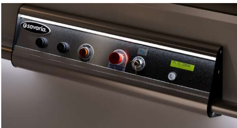
Beleuchtete Drucktasten mit Totmannsteuerung und Diagnosedisplay