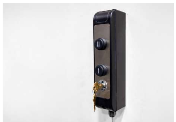
Separate Rufstation für optionale Pfosten- oder Wandmontage