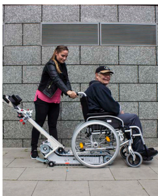
Tirare la sedia a rotelle sul cingolo per scale