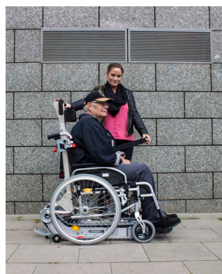
Fissare la persona sulla sedia a rotelle