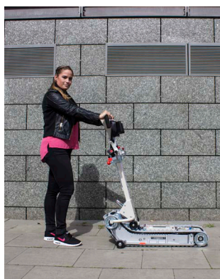
Posizione di partenza